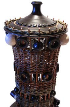
(détail) Elévations BAROTTE - DEFRASNE