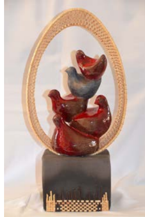
Ecllosion BRUNET - CHAPUIS