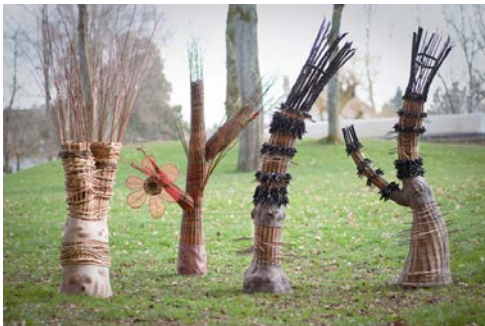
Saule y terre CALVAT – VIDAL - MAITRE - CHEVILLAT