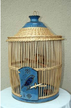
Cage à oiseau BENETIERE - BOULEY